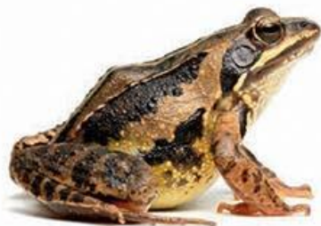
plavček ali barska žaba (3–5 cm)