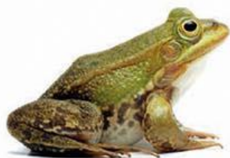
pisana žaba (4,5–7 cm)

PRI NAS ŽIVI 13 od skupno 41 v Evropi živečih vrst žab. Populacije nekaterih vrst se kljub različnim varstvenim ukrepom, med katerimi so tudi prepoved lova in zaščita njihovih habitatov, zmanjšujejo, nekaterim pa gre zaradi večje prilagodljivosti bolje. Nekoč so žabe pogosto lovili zaradi zaslužka, ki so ga prinašali kraki.