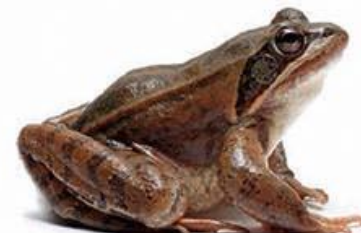
rosnica (4,5–8 cm)

PRI NAS ŽIVI 13 od skupno 41 v Evropi živečih vrst žab. Populacije nekaterih vrst se kljub različnim varstvenim ukrepom, med katerimi so tudi prepoved lova in zaščita njihovih habitatov, zmanjšujejo, nekaterim pa gre zaradi večje prilagodljivosti bolje. Nekoč so žabe pogosto lovili zaradi zaslužka, ki so ga prinašali kraki.