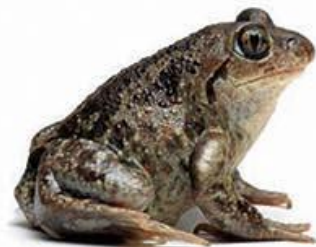
navadna česnovka (4–9 cm)