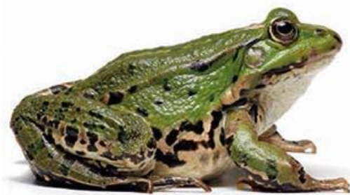
zelena žaba (7–12 cm)