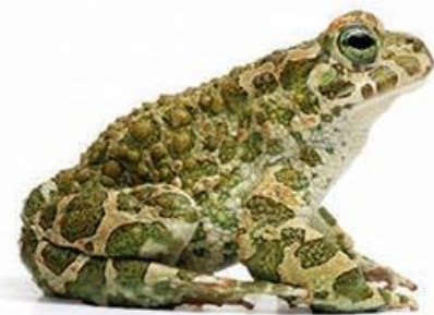
zelena krastača (8–10 cm)