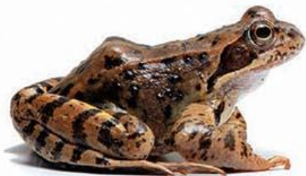
sekulja (4,5–9 cm)