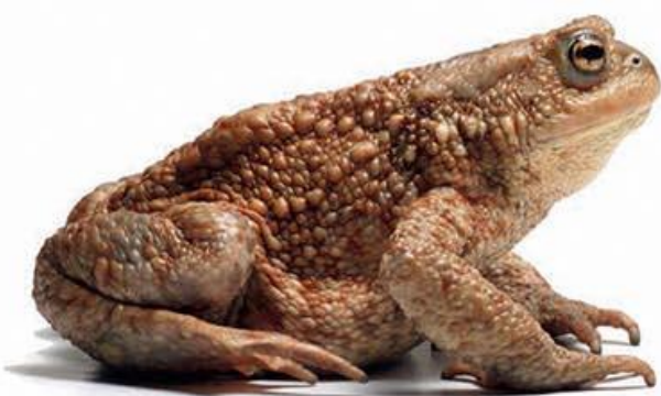
navadna krastača (10–15 cm)