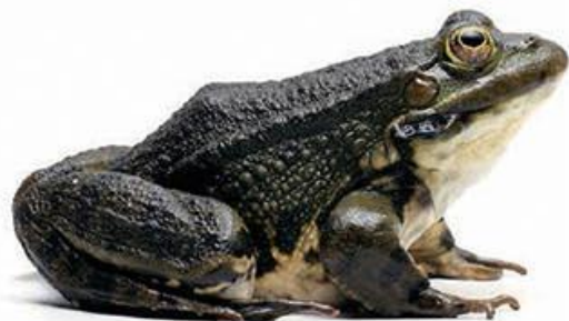
debeloglavka (10–15 cm)