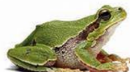
zelena rega (3–5 cm)