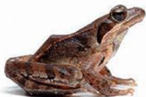
laška žaba (5,5–7,5 cm)