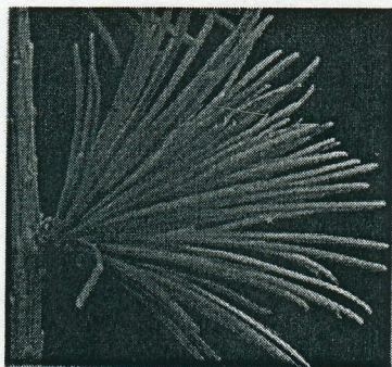
IGLICE MACESNA RASTEJO V ŠOPIH.