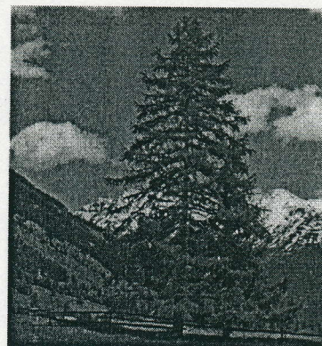
MACESEN LAHKO DOSEŽE STAROST DO 600 LET. VČASIH TUDI VEČ.