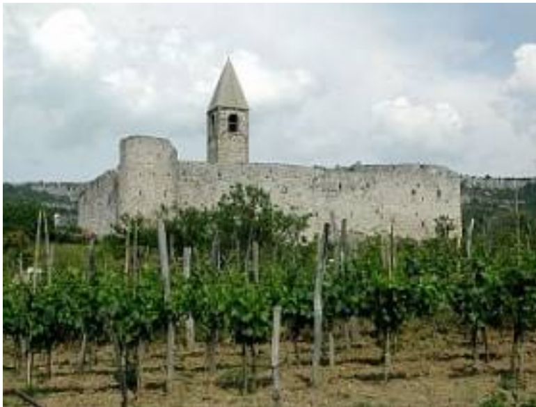
Slika 4: Hrastovlje – taborska cerkev, 15. stoletje

Pred turškimi vpadi so se fevdalci zatekli za obzidja svojih gradov, meščani za obzidja mest, kmetje pa samo za obzidja okoli cerkva. Razloži, zakaj so bili s turškimi vpadi bolj ogroženi kmetje kakor meščani in fevdalci. Odgovor zapiši na črte.