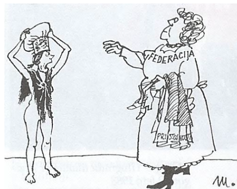
Slika 11: Karikatura Slečena Slovenija