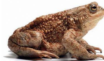
B) navadna krastača