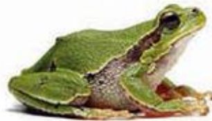
D) zelena rega

5. V katerem letnem času se žabe odpravijo na pot proti stoječim ali počasi tekočim vodam?