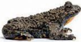
C) hribski urh