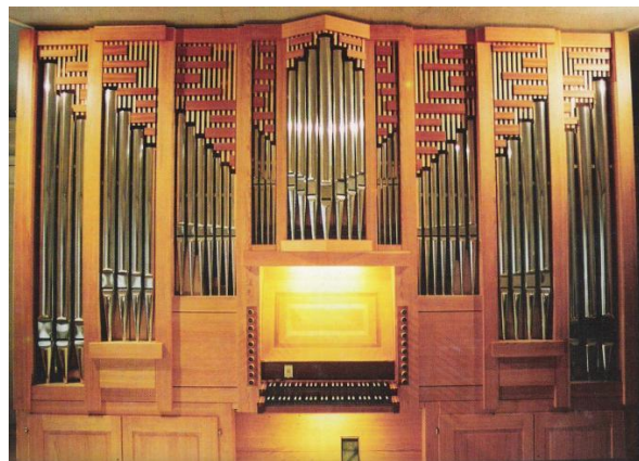
← ORGLE →