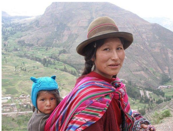
SLIKA 4: INDIJANKA IZ PLEMENA KEČUA Z OTROKOM V PERUJSKIH ANDIH