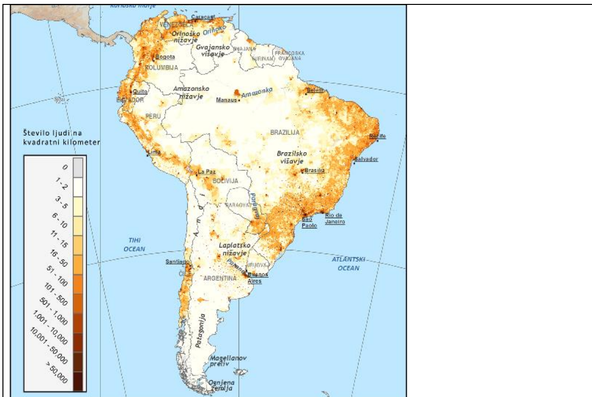
SLIKA 1: GOSTOTA POSELITVE JUŽNE AMERIKE