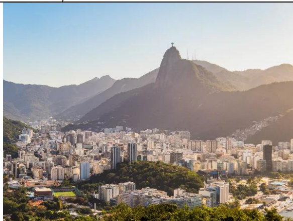
SLIKA 7 in 8 : DVA OBRAZA RIA DE JANEIRA (BRA.)— na levi favela, na desni moderno mesto, ki je leta 2016 gostilo poletne olimpijske igre