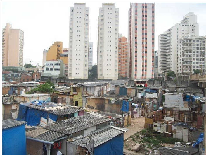
SLIKA 6: FAVELA V BRAZILIJ