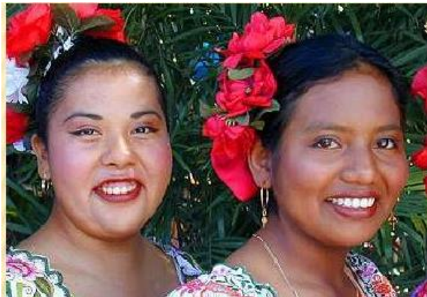
SLIKA 5: PRIPADNICI MESTICEV V LATINSKI AMERIKI