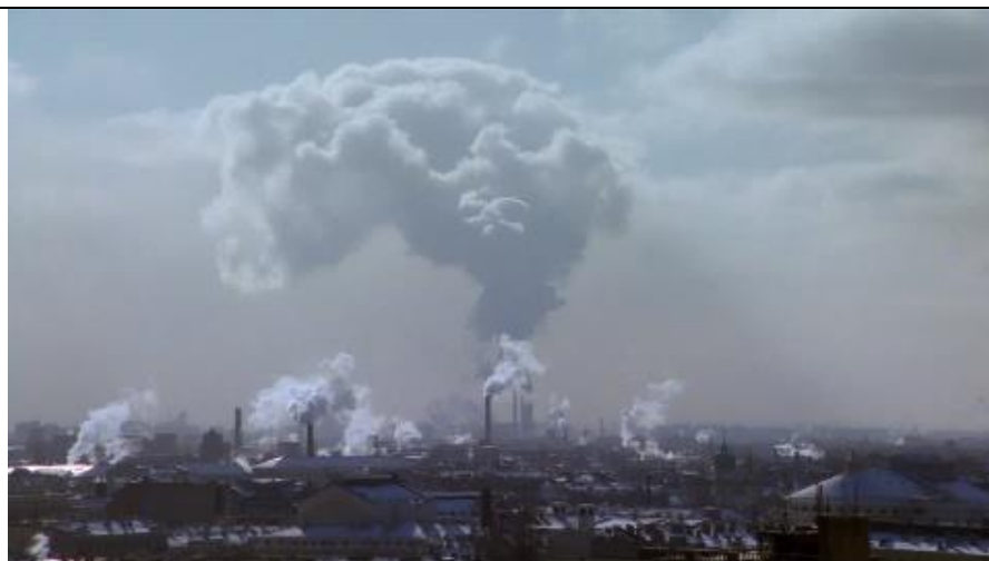
SLIKA 5: INDUSTRIJA MOČNO ONESNAŽUJE OKOLJE (ST. PETERSBURG, RUSIJA, LETA 2006)