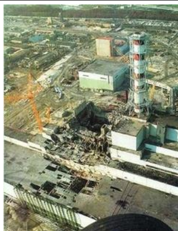
SLIKA 6: ČERNOBIL (današnja Ukrajina): JEDRSKA NESREČA