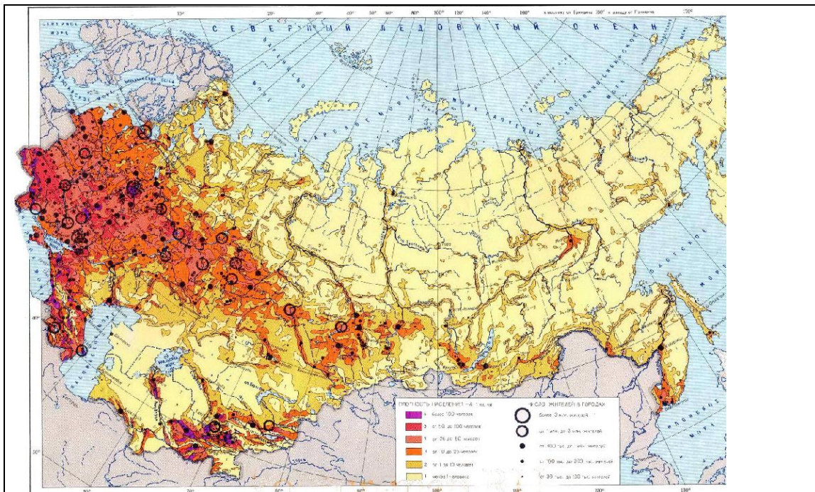
SLIKA 1: GOSTOTA POSELITVE V VZHODNI EVROPI IN SEVERNI AZIJI (RUSIJI)

Legenda: temnejša barva pomeni večjo gostoto poselitve