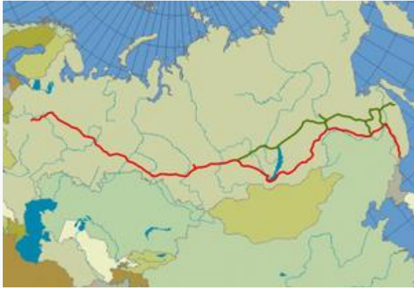
Slika 7 : TRANSSIBIRSKA ŽELEZNICA (rdeče), bajkalsko-amurska magistrala (BAM) (zeleno). Dolžina proge: 9.288 km (najdaljša železnica na svetu)