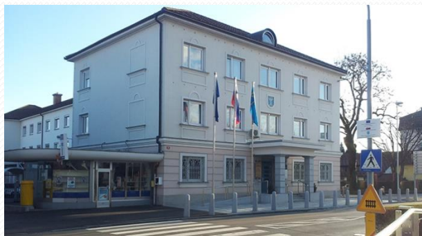
OBČINSKA STAVBA ALI MESTNA HIŠA S SLAMNIKARSKIM PARKOM