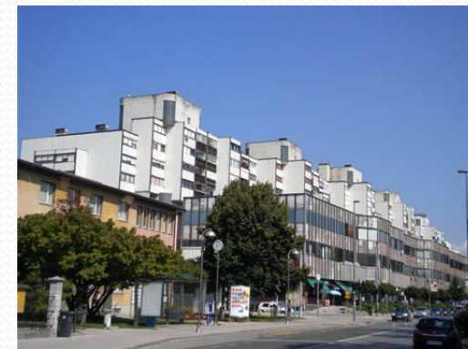
SPB - STANOVANJSKO – POSLOVNI CENTER