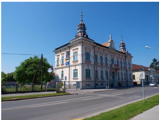
KD FRANCA BERNIKA