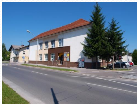
CENTER ZA MLADE