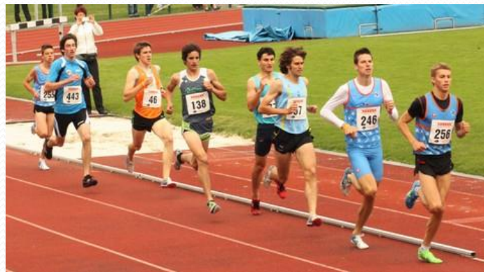
NOGOMETNI IN ATLETSKI STADION