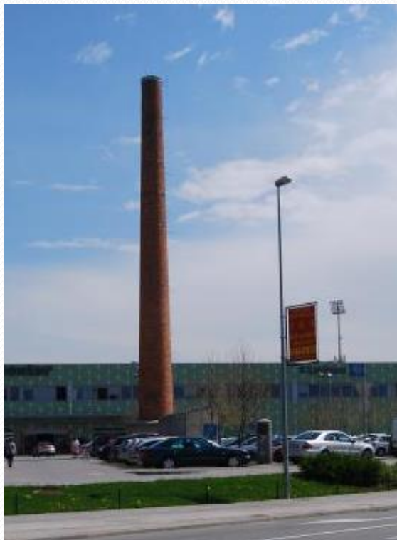
DIMNIK-OSTANEK SLAMIKARSKIH TOVARN