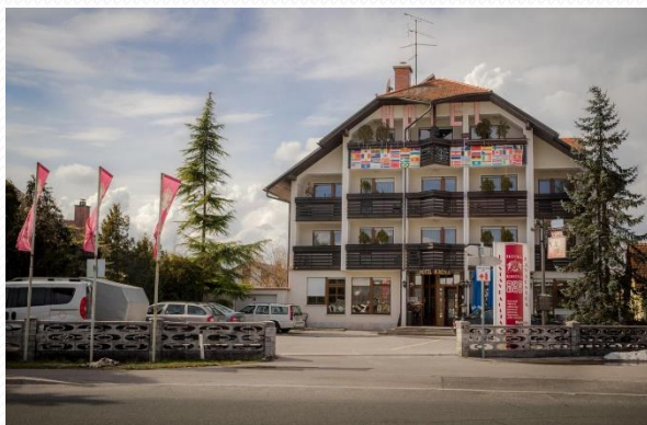
HOTEL IN RESTAVRACIJA KRONA