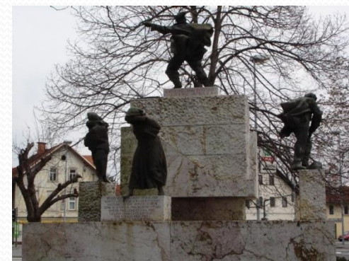
SPOMENIK PADLIM BORCEM