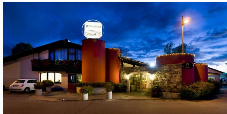
RESTAVRACIJA PARK ZRAVEN BAZENA