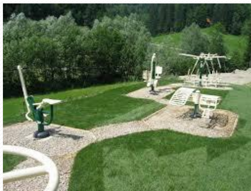
FITNES NA PROSTEM