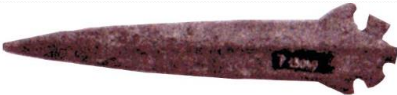
Bronasto bodalo, najdeno v strugi Kamniške Bistrice.