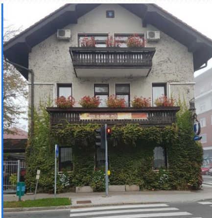
KEBER – NAJSTAREJŠA V DOMŽALAH