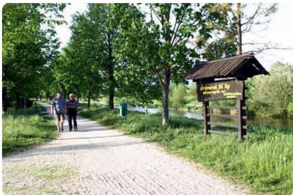
SPREHAJALNE POTI OB REKI KAMNIŠKI BISTICI