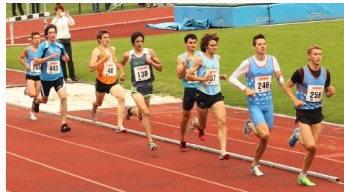
IN ATLETSKI KLUB DOMŽALE