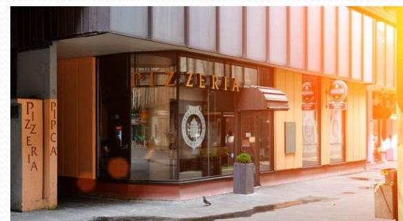
PICERIJA PIPCA- NAJSTAREJŠA V SLOVENIJI