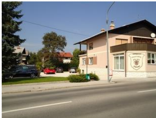
GOSTILNA JUVAN slovi po dobri GOVEJI ŽUPCI