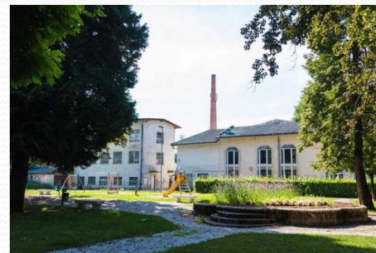
UNIVERZALE- ZADNJA SLAMNIKARSKA TOVARNA