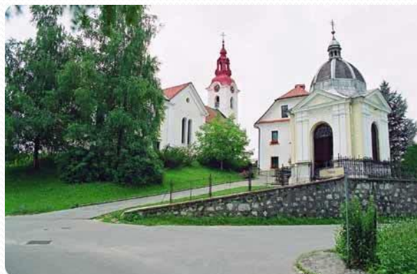
DOMŽALSKA CERKEV NA GORIČICI